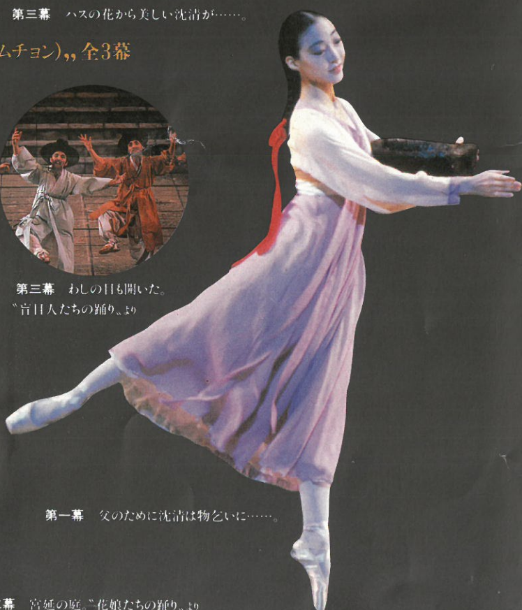
第一幕 父のために沈清は物を乞いに……