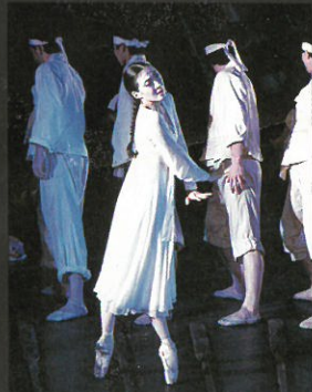
第一幕 風の襲来。沈清は供物に……