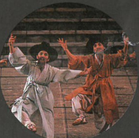
第三幕 わしの目も開いた。 「盲人たちの踊り」, 19

王と出会って結婚し幸せに暮らしていた沈清は父親とも再会、二人がひとと抱きあうと父親の目に光が戻る。