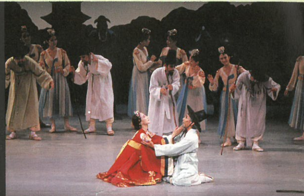
第三幕 天帝との約束が果たされた……