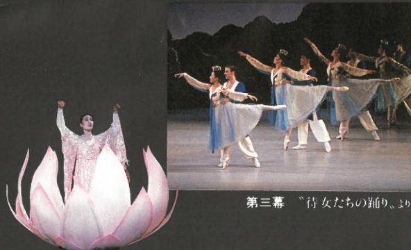
第三幕 「侍女たちの踊り」, 19