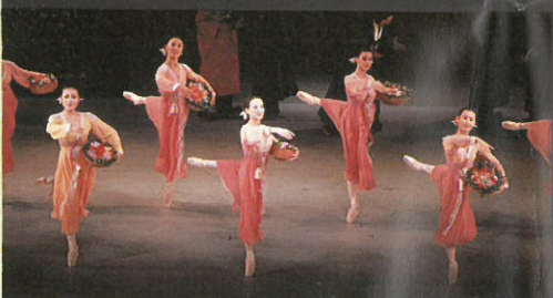
第三幕 宮廷の庭。「花娘たちの踊り」, 19